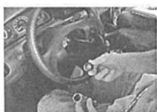
7. Retirar a porca do volante