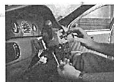
11. Afrouxar o parafuso da abraçadeira posicionado na parte de trás, que fixa a chave de seta à coluna de direção