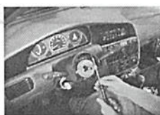
10. Retirar a capa superior da coluna de direção