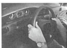
8. Retirar o volante