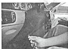
9. Retirar a capa inferior da coluna de direção